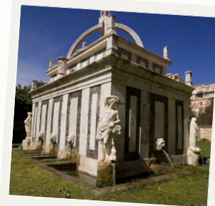
FONTANA DI ROSELLO INGRESSO GRATUITO

FAMIGLIE CON ALMENO UN FIGLIO 6 - 18 ANNI